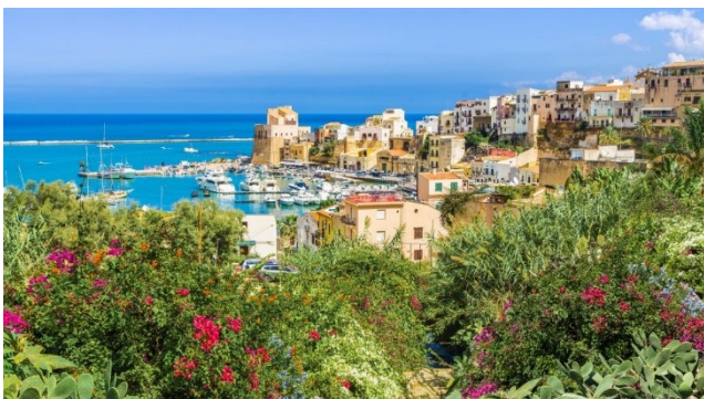
Detailprogramm - Italien - Yoga auf Sizilien: Meer, Kulinarik & Erholung

Wir empfehlen die Buchung eines Mietwagens ab / bis Flughafen, um die wunderschönen Ausflugsziele in der Umgebung des Hotels individuell zu erkunden. Gerne erstellen wir Ihnen ein passendes Angebot.